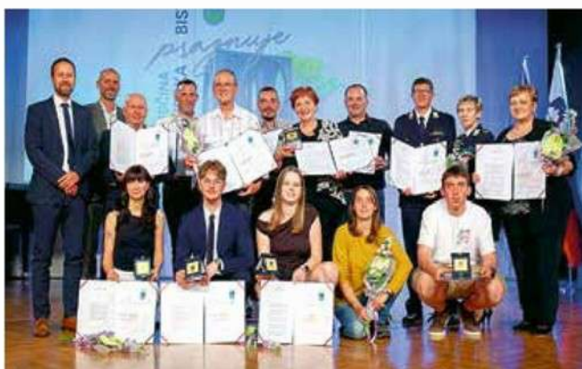
Prejemniki občinskih priznanj 2026

ILIRSKA BISTRICA • Praznik občine in nagrajenci