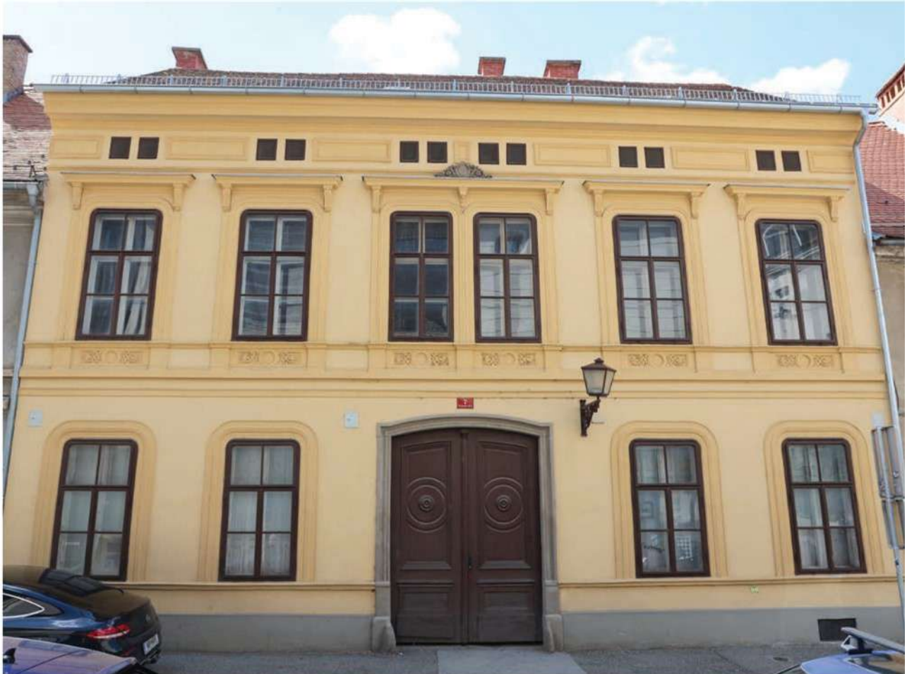
Hiša v Orožnovi ulici 7, ki jo JMSS Maribor uvršča med nepremičnine za prodajo. Zaradi dotrajanosti in visokih stroškov obnove bo sklad zanjo iskal novega lastnika.