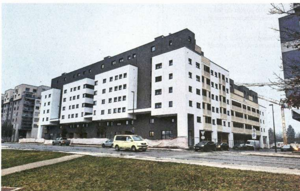
Večji delež javnih najemnih stanovanj je zaseden. Fotografija je simbolična.

Trenutno za Ljubljančane, ki zaprosijo za stanovanje, povprečna neprofitna najemnina znaša 5,68 evra na kvadratni meter, povprečna prosto oblikovana najemnina za stanovanje v lasti JSS MOL pa stane 8,68 evra na kvadratni meter. Cena se je v zadnjih treh letih precej spremenila. Aprila 2023 je namreč najemnik za neprofitno najemnino odšteli 4,69 evra na kvadratni meter, prosto oblikovana najemnina pa je takrat znašala 7,24 evra na kvadratni meter. Skupno so se cene tako povišale za okoli 20 odstotkov. Letno sicer JSS MOL prejme okoli 3700 vlog na razpis, pri čemer glede na primanjkljaj javnih najemnih stanovanj dejansko dodelijo stanovanja